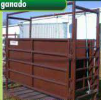
Puerta de ingreso tipo guillotina. Puerta delantera para abrir con pasador.

Jaula pesa ganado fabricados en caños y chapas de acero de alto impacto, con tratamiento anti oxido y pintura industrial, adaptables a cualquier brete. Equipados con balanzas electrónicas marca VESTA a partir de 1500 Kg.